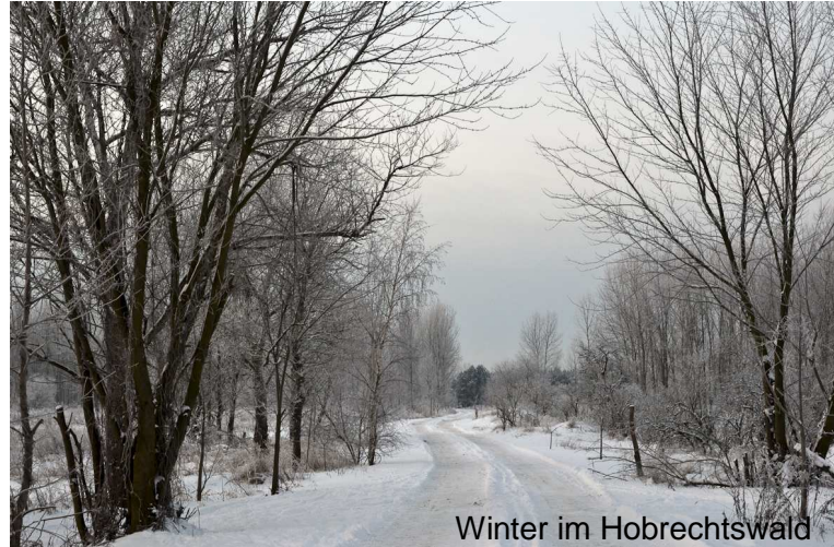
Winter im Hobrechtswald

Heute kann man in dem großen Areal stundenlang Wandern oder Spazieren ohne einen Weg zweimal gehen zu müssen. Besucher können entlang des Rieselpfades nicht nur eine abwechslungsreiche Natur erleben sondern auch von Künstlern aus aller Welt aufgestellte Skulpturen bestaunen, eine als „Steine ohne Grenzen“ weit bekannte Freiluftgalerie.